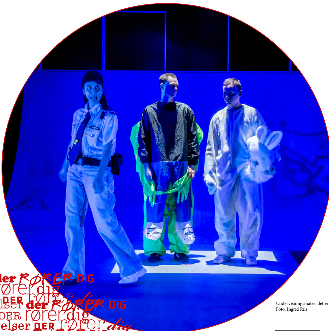
Undervisningsmaterialet er udarbejdet af Anne Nymark